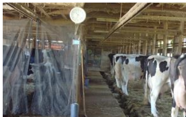
抗体陽性牛と陰性牛の分離飼育