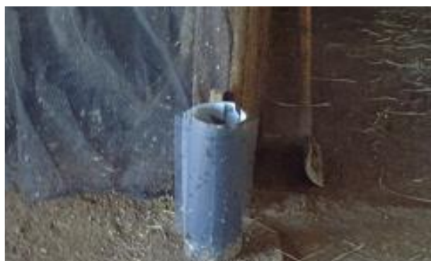
媒介昆虫粘着シート