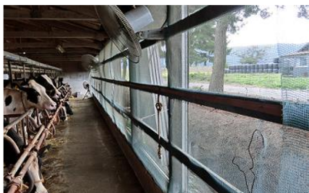
畜舎周辺への防虫ネット設置