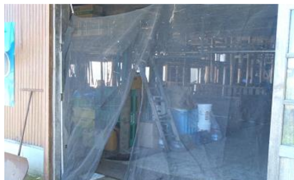
畜舎開口部への防虫ネット設置