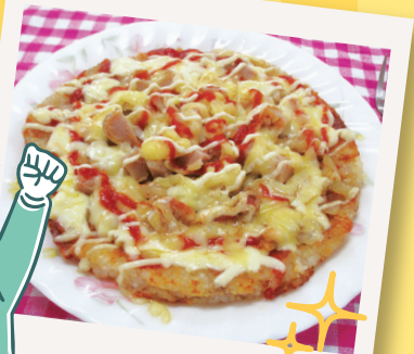
あまったごはんで作る! ライスピザ