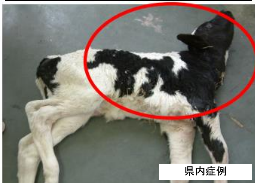
新生子牛の体形異常（後弓反張）