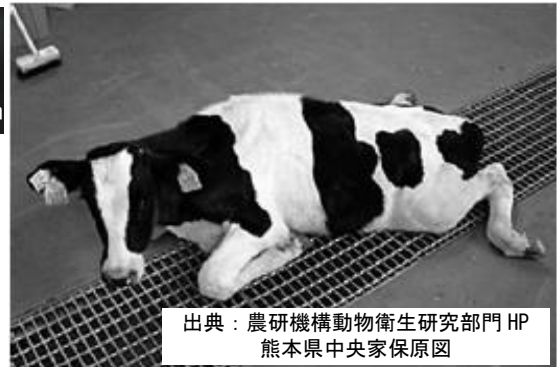
育成牛の脳脊髄炎（起立不能）