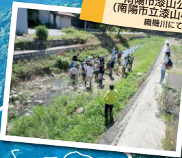
南陽市漆山公民館 (南陽市立漆山小学校) 榎石川にて