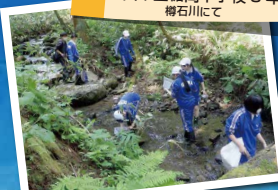
ふるさと教育の森 村山市立榎岡中学校 3年 榎石川にて