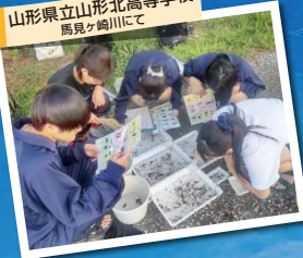
山形県立山形北高等学校 馬見ヶ崎川にて