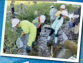
山形市立第八小学校 馬見ヶ崎川にて