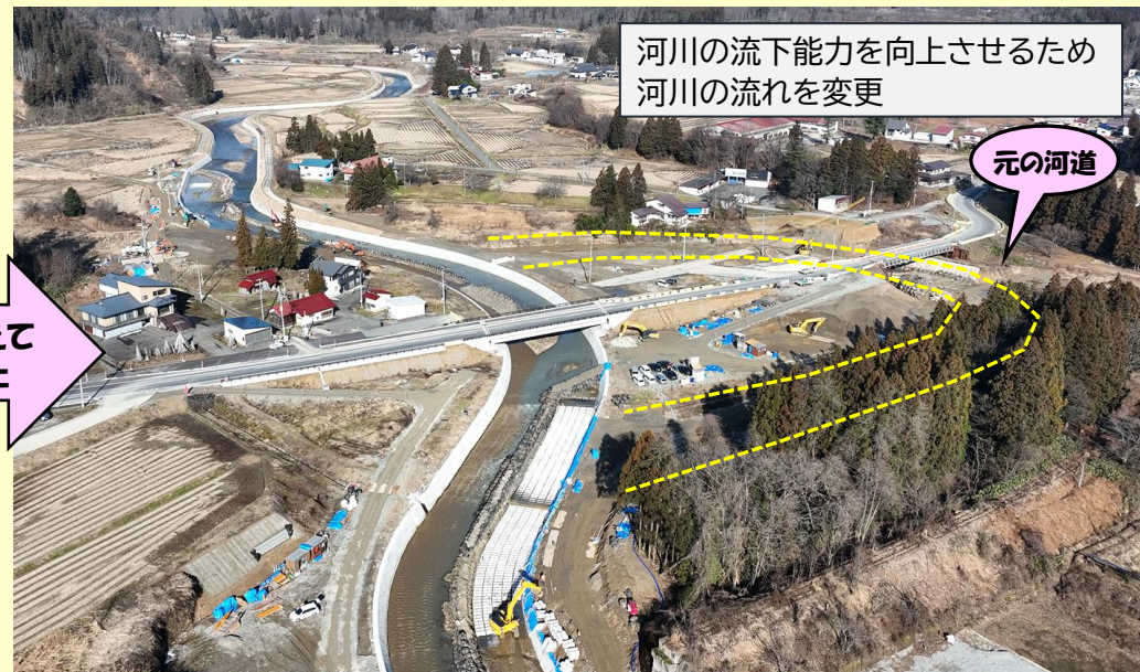
河川の流下能力を向上させるため 河川の流れを変更