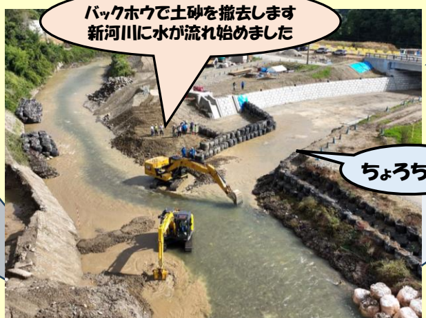
バックホウで土砂を撤去します 新河川に水が流れ始めました