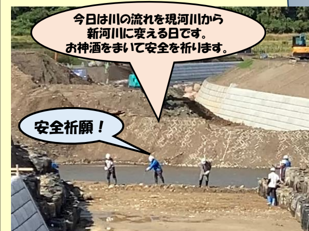
今日は川の流れを現河川から 新河川に変える日です。 お神酒をまいて安全を祈ります。