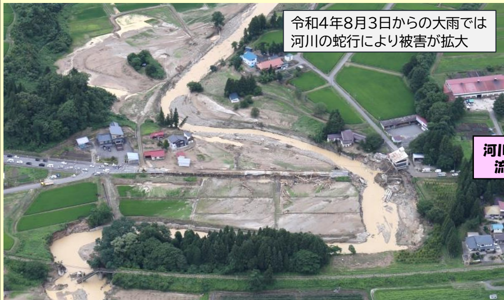
令和4年8月3日からの大雨では 河川の蛇行により被害が拡大

今日の現場 ▶▶ 令和6年度(債務負担行為)災害復旧助成事業小白川災害復旧助成工事(第4工区) 施工者:樋口建設株式会社 現場代理人:飯澤