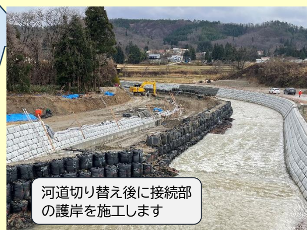
河道切り替え後に接続部 の護岸を施工します