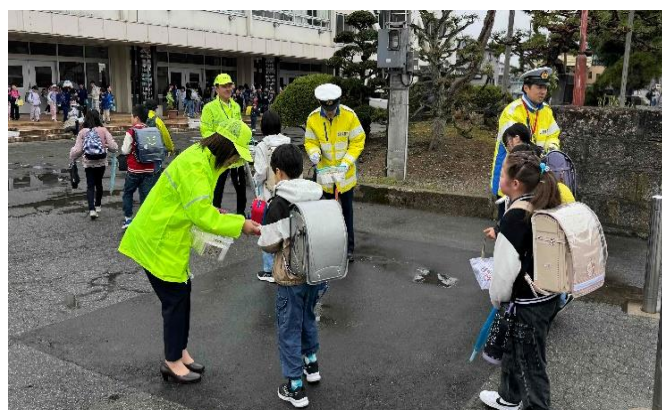
[総務課防災安全室 29-1209]

未来ある子供たちを交通事故から守ることは大人の責任です。県民みんなで思いやりを持って、交通事故を防ぎましょう。