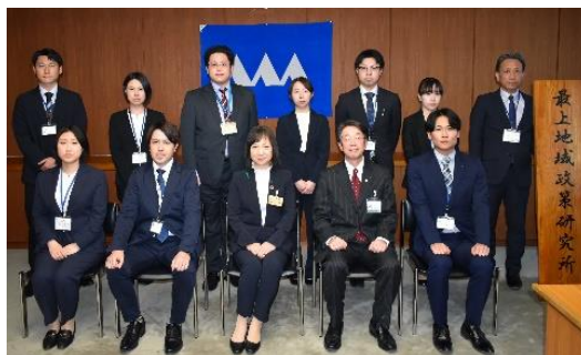
↑第8期の研究活動メンバー（辞令交付式にて）

そして、4月23日(木)、第8期(R8~R9)研究活動の幕開けとして、市町村と最上総合支庁から推薦された若手職員9名に対し、辞令交付を行いました。今期のテーマは「多様な担い手との共創で最上を元気に!!」です。研究員は、若手職員らしい自由な発想で政策を提案し、実際に県や市町村の事業として採用されることを目指します。最上総合支庁では、研究活動をしっかりサポートしてまいります。