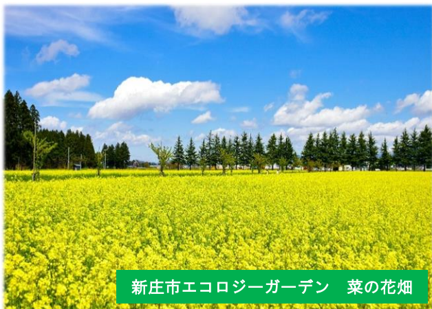
新庄市エコロジーガーデン 菜の花畑