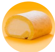
堂島ロール(ハーブ)