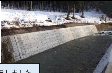
【松橋川（舟形町堀内地内）】