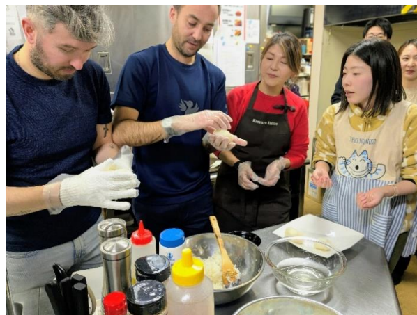
芋煮と一緒にいただくおにぎりを握っています…🍣