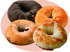
紀ノ国屋のベーグル