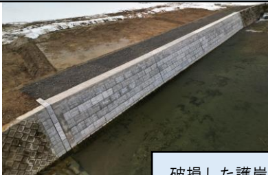
破損した護岸を復旧しました