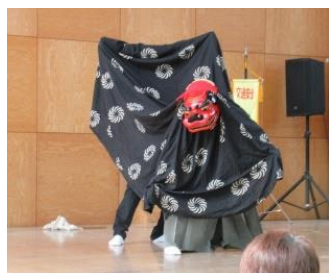
[総務課防災安全室 29-1209]