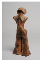
国宝土偶「縄文の女神」

老朽化する施設・設備の機能維持を図るとともに、山形の宝である所蔵資料を未来につなぎ、学びを通じて“やまがた愛”を育むことができる博物館を目指し、複数年をかけて抜本的な資料整理・台帳整備を行います。