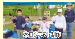
木工クラフト制作