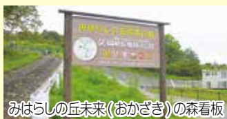
みはらしの丘未来(おかざき)の森看板