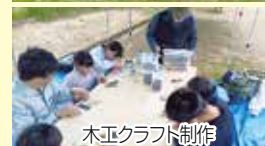
木工クラフト制作