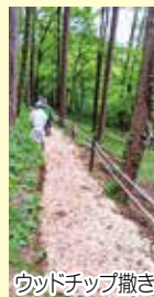
ウッドチップ撒き