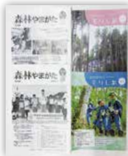
森林やまがた・もりしあ