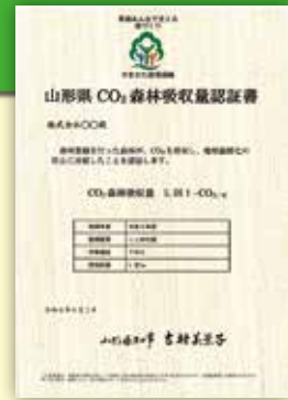
山形県CO 2 森林吸収量認証書

※認証には、森林所有者との協定等により複数年の事業計画を作成する必要があります。