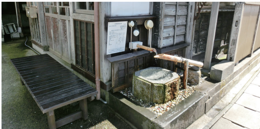
都合により、ただいまご利用いただけなくなっています。