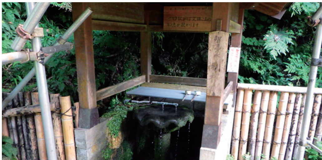
〔管理者〕 亀岡文珠 (松高山大聖寺) 〔保全団体〕 亀岡文珠