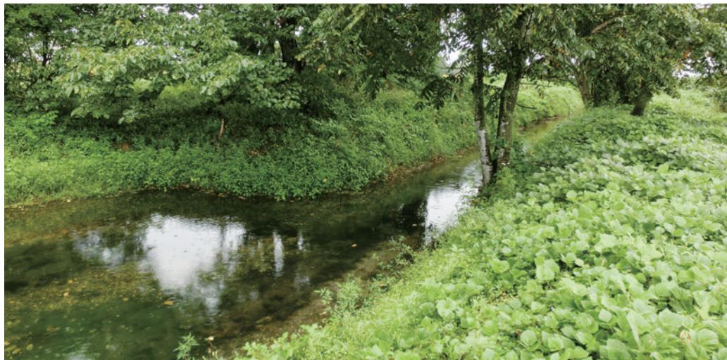
〔管理者〕米沢平野土地改良区 〔保全団体〕堀金大学会