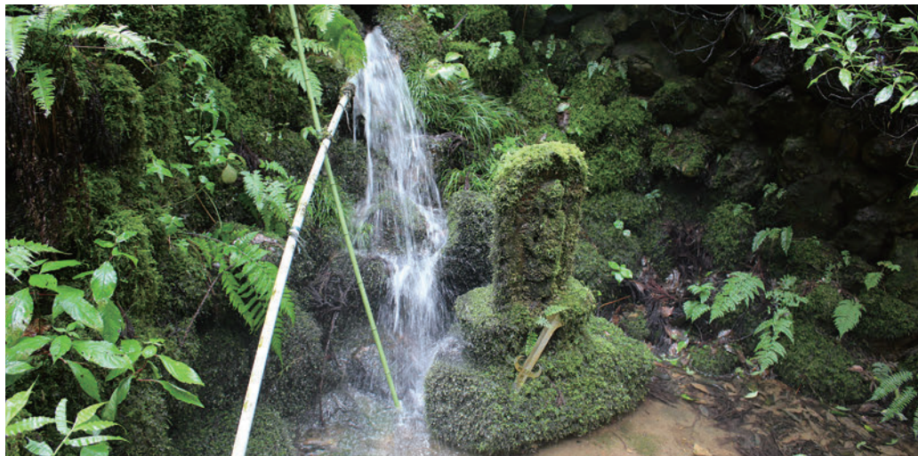
〔管理者・保全団体〕 風間町内会