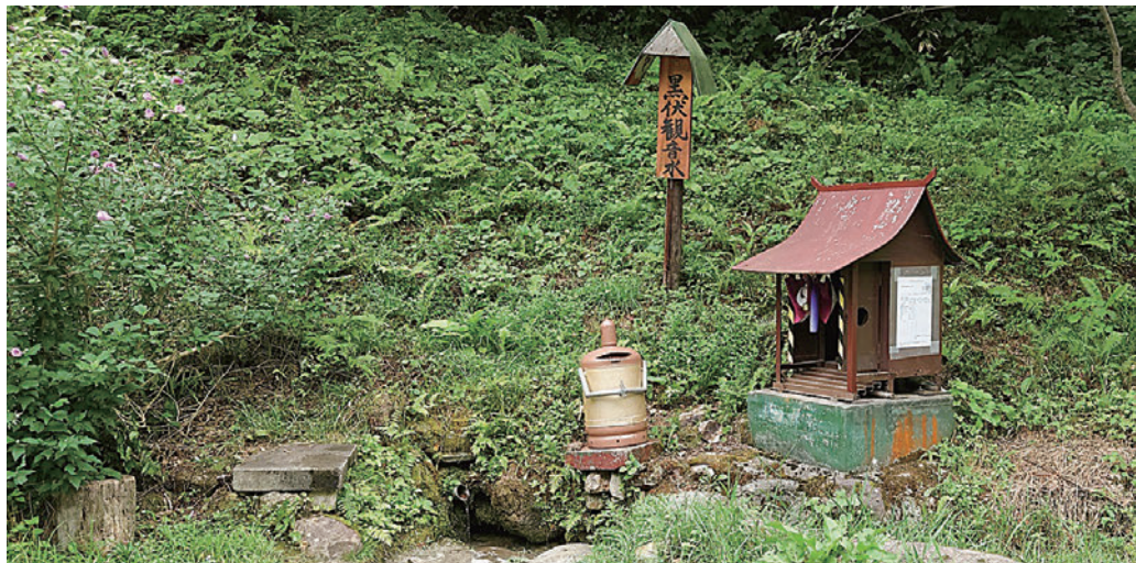
〔管理者・保全団体〕観音寺生産森林組合