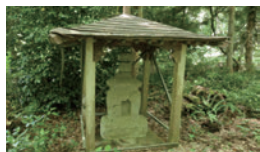
〔管理者〕上貫津町内会〔保全団体〕津山の自然を守る会