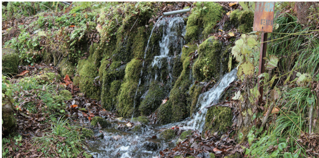
〔管理者〕戸沢地域市民センター 〔保全団体〕樽石いきものふれあいの里の会