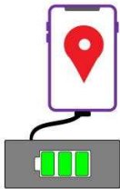
GPSスマホ 予備バッテリー