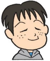
ケロちゃんファミリー 「まもるくん」

インターネットは便利だな～。家にいながら買い物できるし、商品やサービスに関する情報が簡単に手に入れられるよ。