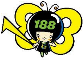
消費者庁 消費者ホット ライン 188 イメージキャ ラクター イヤヤン