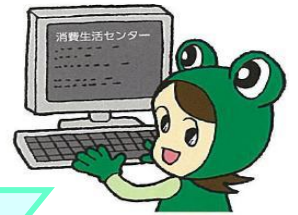
山形県消費生活センター 「ケロちゃん」

便利な反面、新たな消費者トラブルも多いケロ！ ネット広告の仕組みやリスクを理解して、情報の正確さを見極める“消費者力”を高めていくことが重要だケロ！ エシカル（倫理的）で賢い消費生活の知識を得るため、消費生活センターの「出前講座」を活用してほしいケロ！